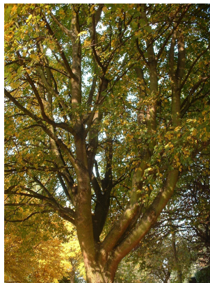
, 22 Octobre 2003